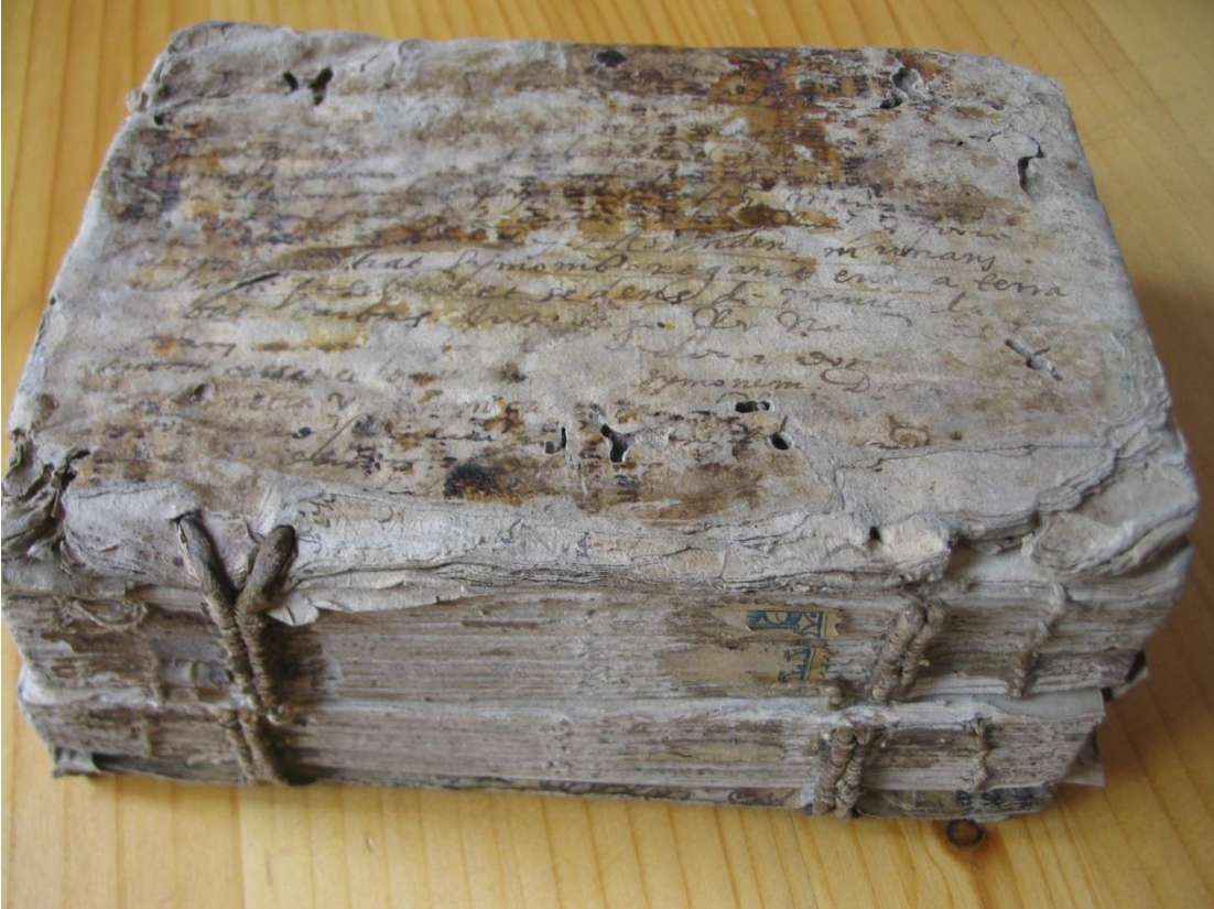
Hátsó tábla és gerinc