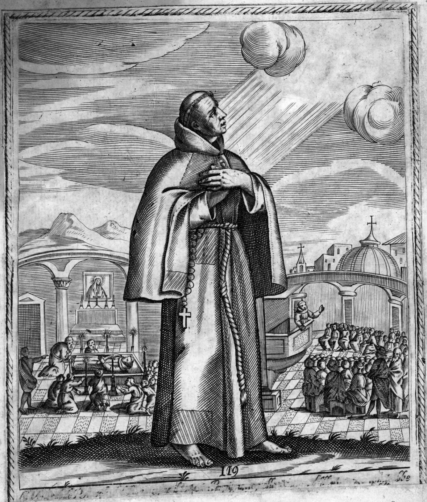
Effigies D. Patris Joannis, Fratris Regis Francisci Philippi, primi in Regno Hungariae Ministri Provincialis Fratrum Minorum, in aureo illo primo Saeculo, Regulam Beatissimi Patris Francisci in puritate observantium. Ad ejus Venerabile Corpus, Angelorum ministerio, ut ipse nec postulavit, ad Conventum Frankovillensem deportatum, tres mortui vitam recuperasse perhibentur.

Vadignus Tom. 2. ad annum 1270. Menalog. Fran. 14 Februarij