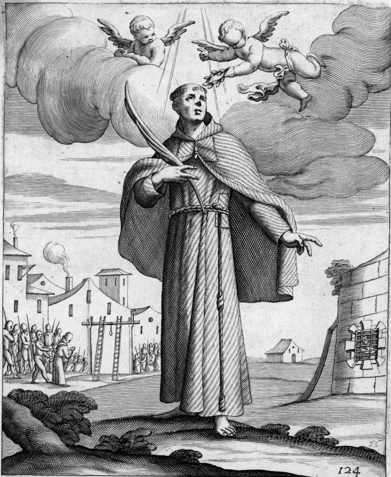
Il Glorioso Martire Pre. Gottifreddo Inalese passato daal'OSS: a Reformati Franciscani ardendo di ueheme